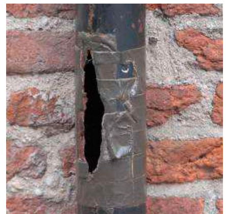
Kapotte delen van de hemelwaterafvoer met hetzelfde materiaal vervangen: vergunningvrij