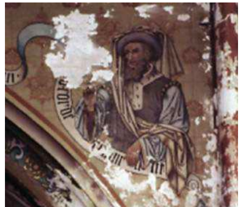
Geen onderhoud, maar restauratie. Vergunning nodig.